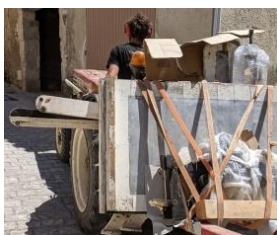
Die Steindruckpresse ist in ihren neuen Standort umgezogen. Sie wird nächstes Jahr wieder in Betrieb sein.

Nach den seltsamen Monaten, die wir hinter uns haben, sind Momente der Begegnung, Kreativität und Entspannung willkommen!