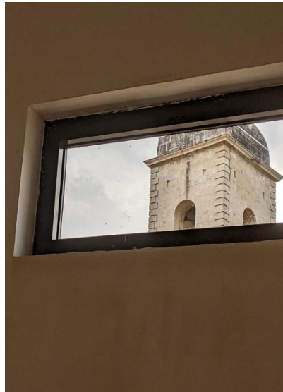
Gerahmte Aussicht der Westseite