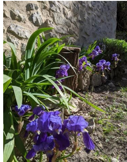
Motiv am Fuß der Stadtmauer